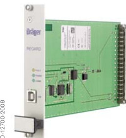
Интерфейсная карта Dräger REGARD